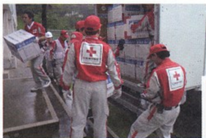
大雨災害で救援物資の搬入を行う