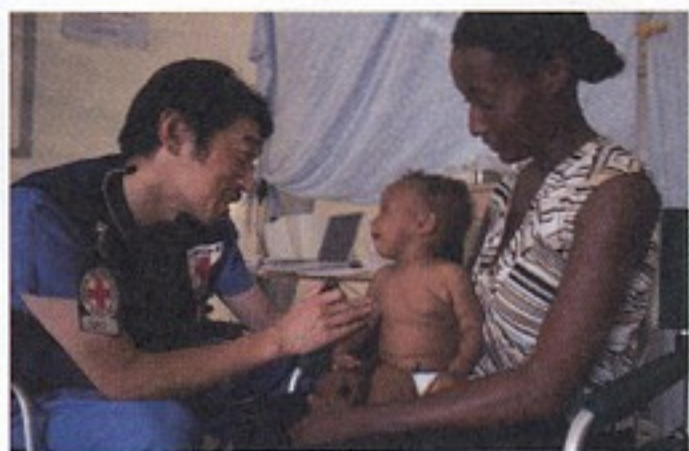
c) Talia Frenkel/American Red Cross. ハイチ地震において診察を行う日赤医師